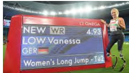
Low ist "Sportlerin des Monats"