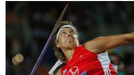
Nerius sieht Behindertensport im Nachteil