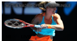
WTA Madrid: Tag 5