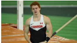
Positiver Dopingtest nach One-Night-Stand